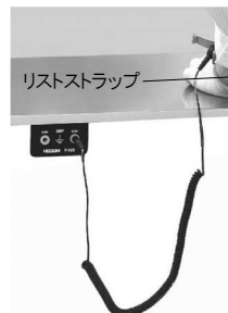
F-154 リストストラップの接続例