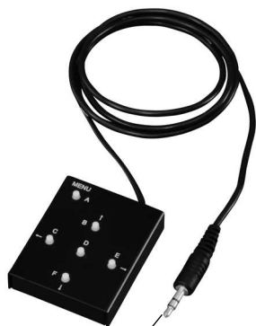
各ボタンの操作説明

このたびは ホーザン L-850-2 カメラコントローラー をお買い上げいただき、まことにありがとうございます。この取扱説明書をよくお読みになり、正しくお使いください。また、お読みになったあとも大切に保管してください。