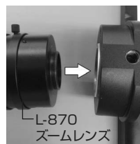
L-870 ズームレンズ L-860 モニター付カメラ