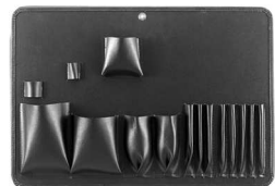
表(写真左)、裏(写真右) face (left photo), back (right photo)