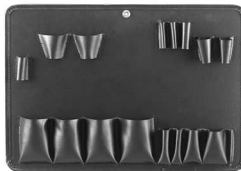
B-740 工具差し B-740 Tool pallet

As a tool pallet, B-740 is recommend- ed if put in an attaché case type of bag .