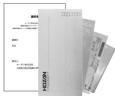
リサイクルキット

封筒 / ビニール袋(大) / 着払い伝票 / 譲渡書 / 伝票袋 / 製品情報(本紙) 各1枚